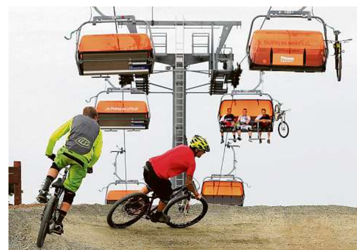
Nová naděje Horská střediska hodlají investovat do letních atrakcí v naději, že přitáhnou lidi a zalepi ztráty ze zimy.

I přes nepříznivou zimní sezonu se areály chystají do léta investovat, i když méně než obvykle. Investice do letních programů se pohybují v řádu desítek milionů korun, nejčastěji poputují do budování či renovací bike parků, naučných stezek nebo gastronomických provozů. Například na Lipně nachystali novinky v zázemí a službách pro letní návštěvníky, na Dolní Moravě zase rozšířili dětské parky o obří vodní brouzdaliště.